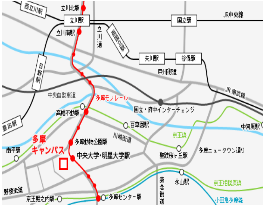
中央大学多摩キャンパス内 第2体育館室内プール (多摩モノレール「中央大学・明星大学駅」徒歩5分)